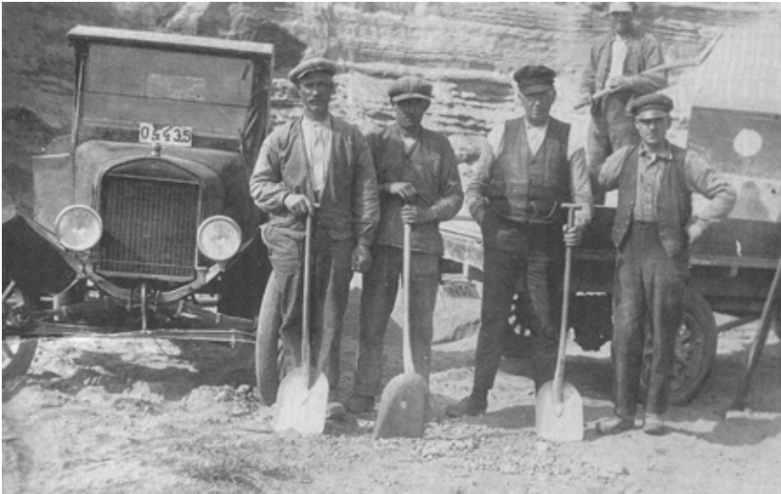
Arbeit 1916, Quelle Okänd fotograf, Okeme hembygdsforening 2011

beschlossene Anwerbestopp beendete zwar die Zuwanderung von Arbeitnehmern, nicht jedoch den Familiennachzug. Im Jahr 2011 hatten 15,96 Millionen (= 19%) der insgesamt 81,75 Millionen Einwohner in Deutschland einen Migrationshintergrund (Zugewanderte und ihre Nachkommen).